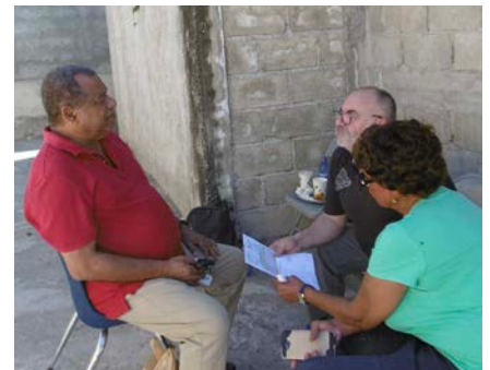
Réunion de cadrage pour les travaux en février 2019

Si tout se passe bien, l'installation du Tableau Numérique Interactif se fera au mois de mai et sera immédiatement suivie de la formation des professeurs, indispensable aussi pour renforcer l'attrait et la qualité pédagogique de cette école qui a besoin de davantage de recettes d'écolage (frais de scolarité) pour gagner en autonomie financière.