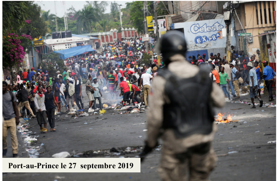
Port-au-Prince le 27 septembre 2019