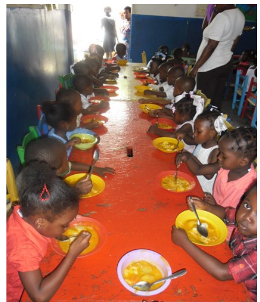
18 mai 2012 - À Marie-Soleil les enfants célèbrent la fête du drapeau national, emblème créé en 1803 quelques mois avant l'indépendance de la première République noire. C'est une fête officielle.

DATE à retenir : 6 avril 2013 : Assemblée Générale et repas annuel - salle Marianne, rue de la Station - Villeneuve d'Ascq